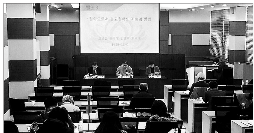
한국불교학회는 1월 30일 동국대 법학관 모의법정실에서 '불교학의 지형도와 방법론 탐구'를 주제로 동계워크숍을 개최했다.