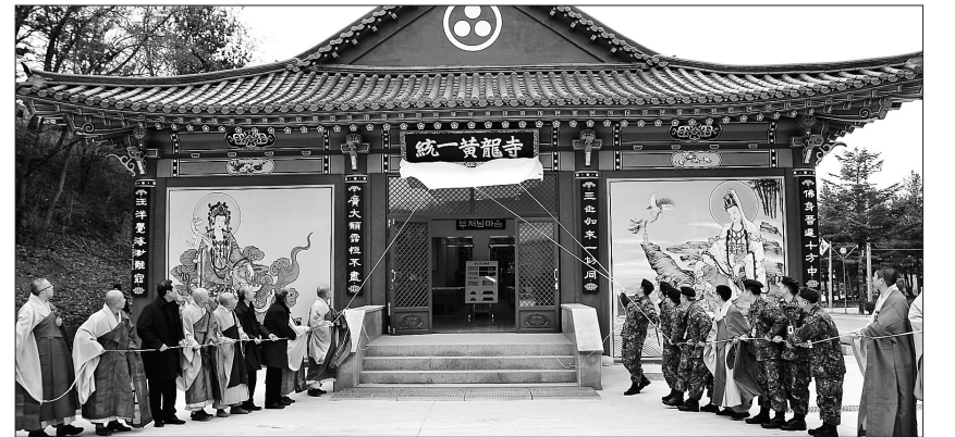
조계종 군중특별교구(교구장 정우)는 1월 29일 경기도 연천 소재 육군 5사단 신병교육대에서 신축법당 통일황룡사 낙성법회를 봉행했다.