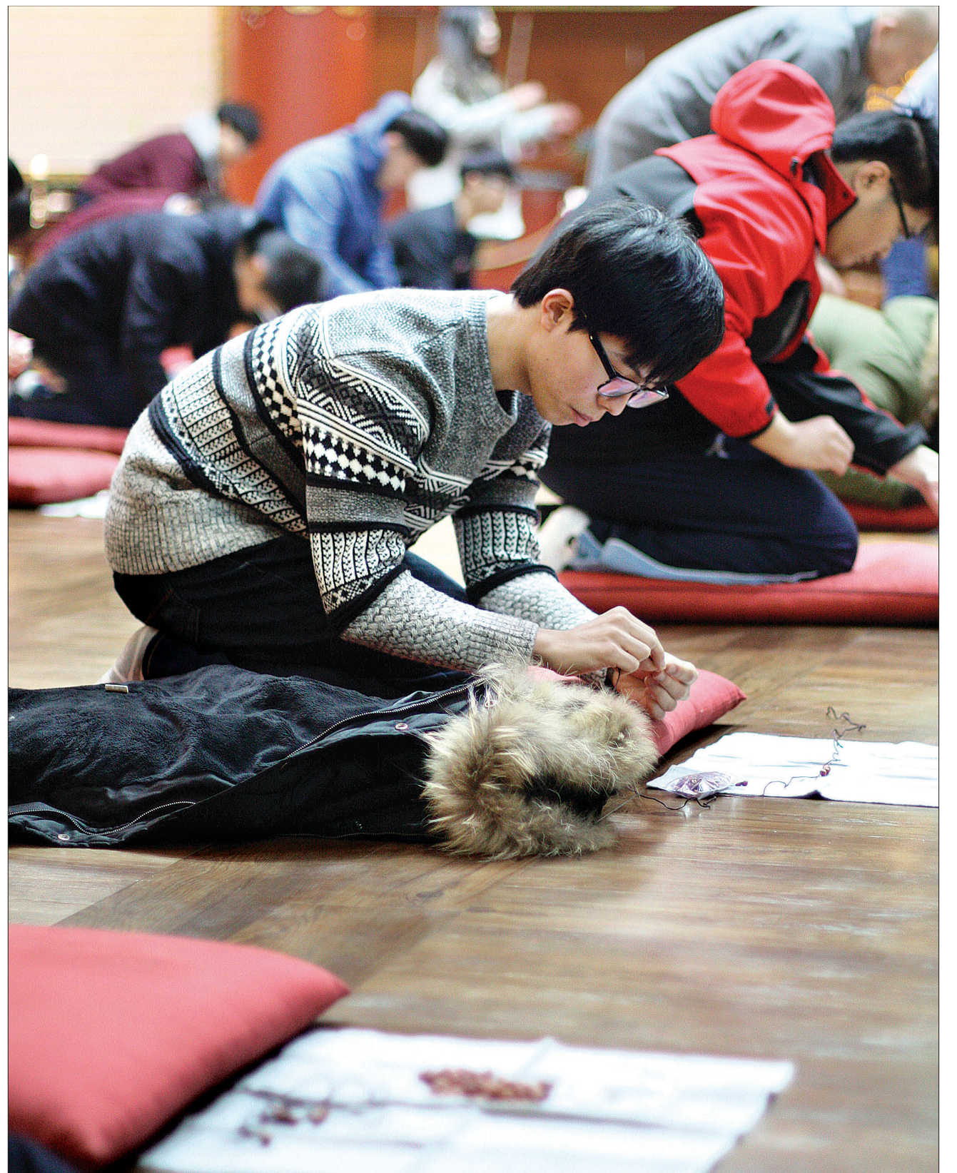
국제불광회 한국부산협회 흥법사의 초청으로 대만 불광대 학생 20여 명이 한국에 방문해 다양한 체험 행사를 했다. 사진은 불광대 학생들이 108배와 염주꿰기를 하는 모습.