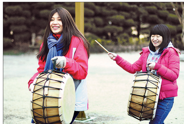
대만 불광대 학생들이 흥법사에서 한국의 전통문화인 사물놀이를 체험하고 있다.