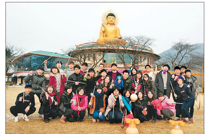
대만 불광대 학생들과 한국 대학생들은 전통문화 체험과 불교 수행 등을 함께 하며 우의를 다졌다.