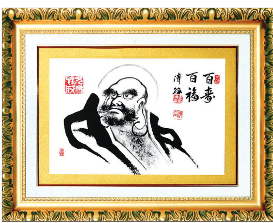
진품 소림 달마도