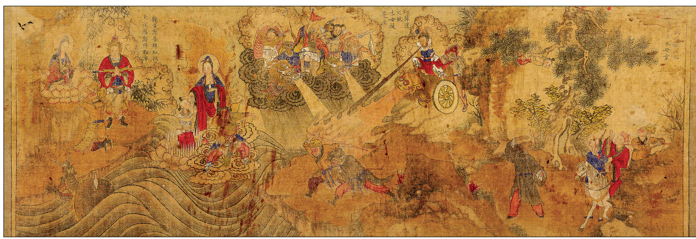
명주사 고관화박물관 서유기 특별전을 통해 처음 일반에 공개되는 '채색 서유기 육필 년화.' 가로 220cm, 세로 90cm의 대형 작품 안에는 손오공과 홍매이의 대결 내용이 담겨 있다.

명주사 고관화박물관 5월 15일까지 '붉은열정-손오공展' 韓中日 손오공 판화 70여점 '눈길'