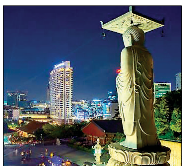
BTN불교TV 설 프로그램 다큐 '봉은사 365일'의 한 장면.

눈길을 끄는 프로그램으로는 금오선사의 수행관과 사상을 알아볼 수 있는 다큐멘터리와 강남불교 1번지 봉은사의 1년을 담은 <봉은사 365일> 등이다.