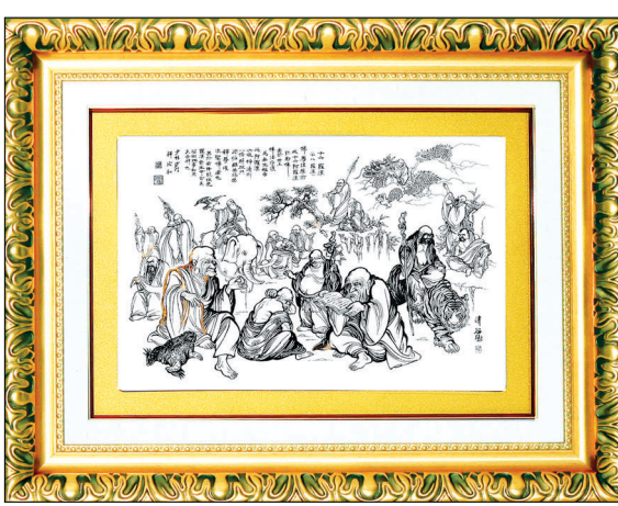
황금순금 나한도 (순도 99%순금)

진품소림달마도는 달마대사의 34대 제자이시고 한국호국불교 소림선종 방장이신 석연화 스님께서 글을 쓰시고 중국소림사 한국본부문화원 운영위원장인 청국 이한동 화백께서 혼신의 힘을 다하여 완성하신 작품입니다.