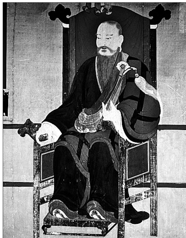
조선시대 고승들은 유학자들과 끊임없이 사상적 교류를 했다. 임진왜란 당시 혁혁한 공을 세웠던 사명대사(사진 왼쪽)와 절친했던 친불적 성향의 유학자 허균(사진 오른쪽)은 유불병행론을 주장했다.

한편 17세기 중반에는 <석문상의초>, <석문가례초>, <승가에의문>과 같은 불교 의례집이 집중적으로 간행되었다. 이 책들의 서문에는 "조선에는 불가의 상례에 대한 근본이 없고 현재 시행되고 있는 것은 규범에 맞지 않는다. <선원정규> 등 불교 상례에 의거하고 있지만 중국의 법이 조선의 예와 맞지 않으므로 그 요점만 간추린다"고 되어있고, 또 "세속의 예인 <주자가례>를 취해 <선원정규> 등에 빠진 내용을 보충하고 그 절요를 간추린다"며 간행의 의미를 설명하고 있다. 이들 불교 의례집에서는 <주자가례>에 의거해 상복을 입는 기간인 오복제를 도입하여 세속의 친족과 같이 승려 사제 간의 멀고 가까운 관계를 촘수로 규정해 놓고 있다. 17세기에는 불교계의 문과가 형성되고 법맥을 이은 사제 간의 결속과 제사 등 상제례의 비중이 커졌다. 또한 승려의 사유 전답을 제자와 친족에게 상속하는 것이 법적으로 가능해짐에 따라 사제 간의 인적 관계망이 상례 위주의 의례집에