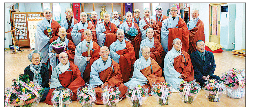
청암사는 승가대학과 울학승가대학원 졸업식을 1월 23일 경내 자양전에서 개최했다.