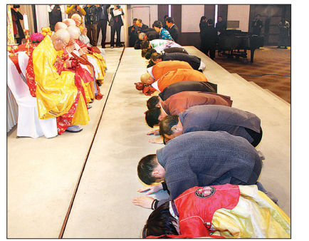
울산불교종단연합회 회원들이 1월 27일 신년하례에서 원로 스님에게 세배를 올리고 있다.