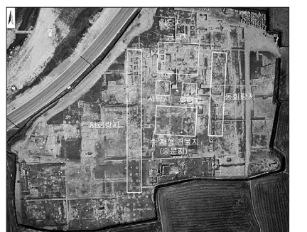
사적으로 승격된 경주 인왕동 사지 전경.

2002년부터 2011년까지 4차례에 걸친 발굴조사 결과, 인왕동 사지는 중문·쌍탑·금당·강당·회랑을 기본으로 하는 신라의 전형적 가람배치를 기본으로 하면서도, 다른 신라 사찰과 비교되는 독특한 건축구조를 이루고 있는 것이 확인됐다.