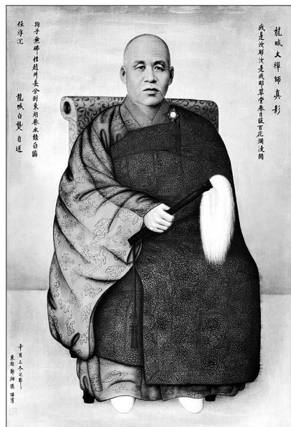
백용성 스님 진영. 대각사 소장본이다. 총서에는 10여 종의 진영이 모두 실린다.

또한 저서를 분류해 부분별로 묶었다. 1그룹의 1책은 선사상을 주제로 <용성선