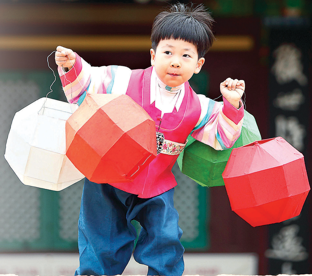
설맞이 사찰 템플스테이에 참가한 어린이가 설빔을 입은 채 직접 만든 전통등을 양손에 들고 즐거워하며 달리고 있다.

음력 1월 1일, 민족명절 설이 코앞으로 다가왔다. 고향에 계신 어르신들은 오랜만에 귀여운 손주들을 볼 생각에 미소가 절로 나고, 아이들은 세뱃돈을 받아 무엇을 할까 고민하며 부푼 꿈에 잠긴다. 하지만 민족 대이동에 따른 교통정체로 받는 스트레스와 징검다리 근무로 고향에 가지 못하는 직장인들의 마음, 명절 음식 준비로 지친 몸은 달콤한 연휴의 즐거움을 반감시킨다. 분명 연휴인데 연달아 한숨만 짓게 되는 건 왜일까?