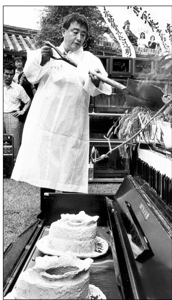
요셉 보이스를 추모하는 진훈관 퍼포먼스 '늑대 걸음으로'를 행하는 백남준의 모습.

세계적 비디오 아티스트로 평가받는 백남준(1932~2006)은 현대미술사에 한 획을 그은 인물이다. 독실한 불교신자였던 그는 <머리를 위한 선> <걸음을 위한 선> <필름을 위한 선> <TV부처> 등 불교를 모티브로 한 작품을 만들기도 했다. 그의 유분(遺粉)은 현재 봉은사에 안치돼 있으며, 봉은사도 매년 1월이 되면 백남준의 추모제를 연다. 진속의 경계를 과격으로서 넘나들었던 백남준의 예술 세계를 그리기 위한 추모 행사들이 그의 10주기를 맞아 잇달아 열린다.