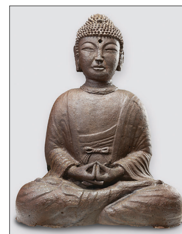
고려 1실에 전시되는 철조 아미타불상.