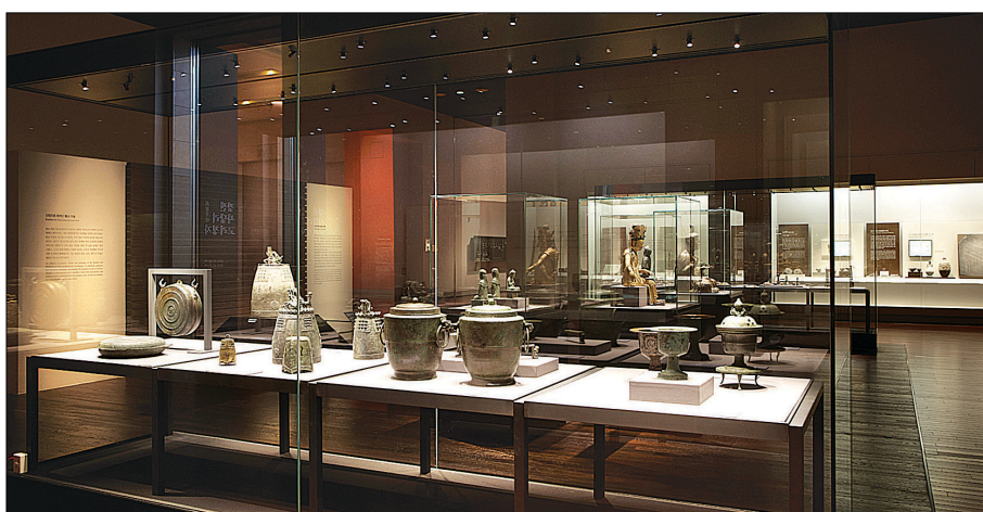
국립중앙박물관의 고려 2실, 새롭게 단장하고 관람객을 맞는다.

서울 국립중앙박물관 발해실·고려실 新단장 공개 철조 아미타불 등 700점 선봬