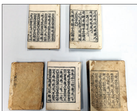
광흥사에서 복장물에서 발견된 <월인석보> 보존 처리를 끝내고 대중에게 첫 공개된다.

주요 국립, 불교박물관이 신년을 맞아 전시실을 정비하고 상설전에 들어간다. 불교중앙박물관은 문화재청과의 공동사업의 성과를 살펴볼 수 있는 상설전을 열며, 국립중앙박물관은 발해실과 고려실을 새롭게 단장해 관람객들을 맞이한다.