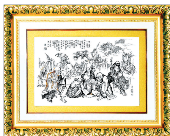
황금순금 나한도 (순도 99%순금)

진품소림달마도는 달마대사의 34대 제자이시고 한국호국불교 소림선종 방장이신 석연화 스님께서 글을 쓰시고 중국소림사 한국본부문화원 운영위원장인 청곡 이한동 화백께서 혼신의 힘을 다하여 완성하신 작품입니다.