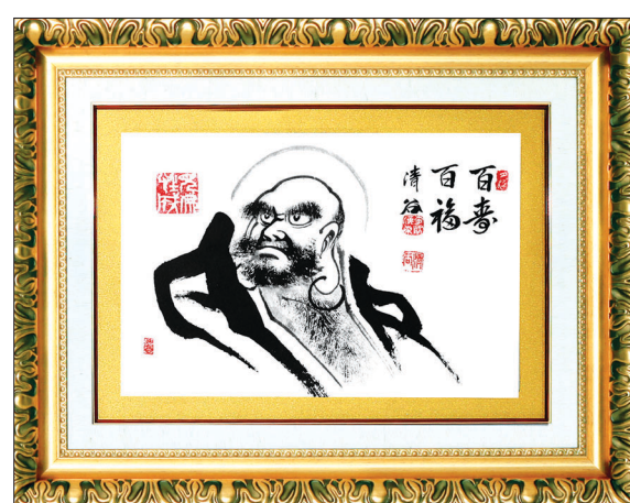
진품 소림 달마도