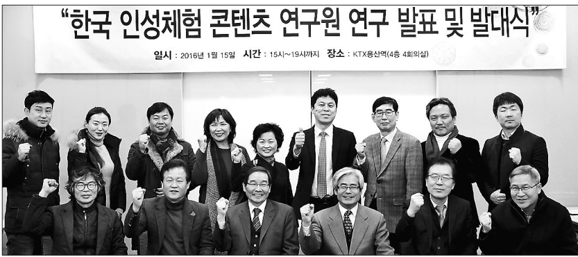
동국대 경주캠퍼스 한국인성체험콘텐츠연구원은 1월 15일 발대식을 개최했다.