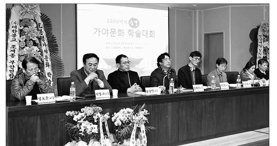
김해 여여정사는 1월 16일 김해 가야대 국제회의실에서 ‘가야문화 원형의 탐색과 콘텐츠화’를 주제로 학술대회를 개최했다.

초기경전인 <잡아함경>에 이미 아유타의 음역어인 ‘아비사’와 ‘아비타’가 나올 뿐만 아니라, 아유타의 개명 전 나라명인 ‘사게타’의 음역어인 ‘사기’와 ‘파기’ 역시 등장하고 있다. 이는 이미