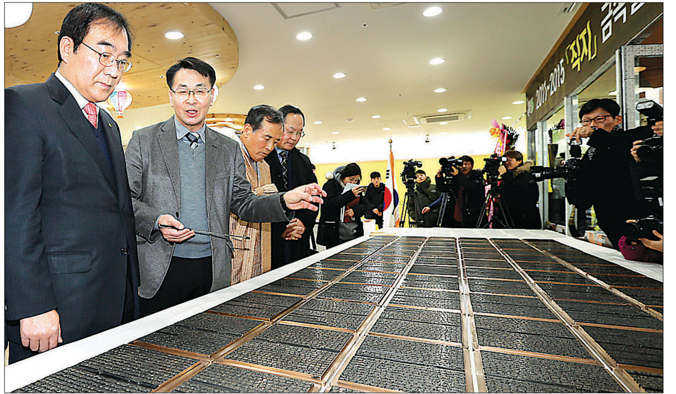
청주고인쇄박물관은 1월 19일 금속활자주조전수관에서 복원한 직지 금속활자를 공개했다.