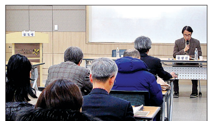
불교학술원은 1월 20일 동국대 중앙도서관 컨퍼런스룸에서 '불교기록문화유산 아카이브 사업의 성과와 전망'이라는 주제로 세미나를 개최했다.