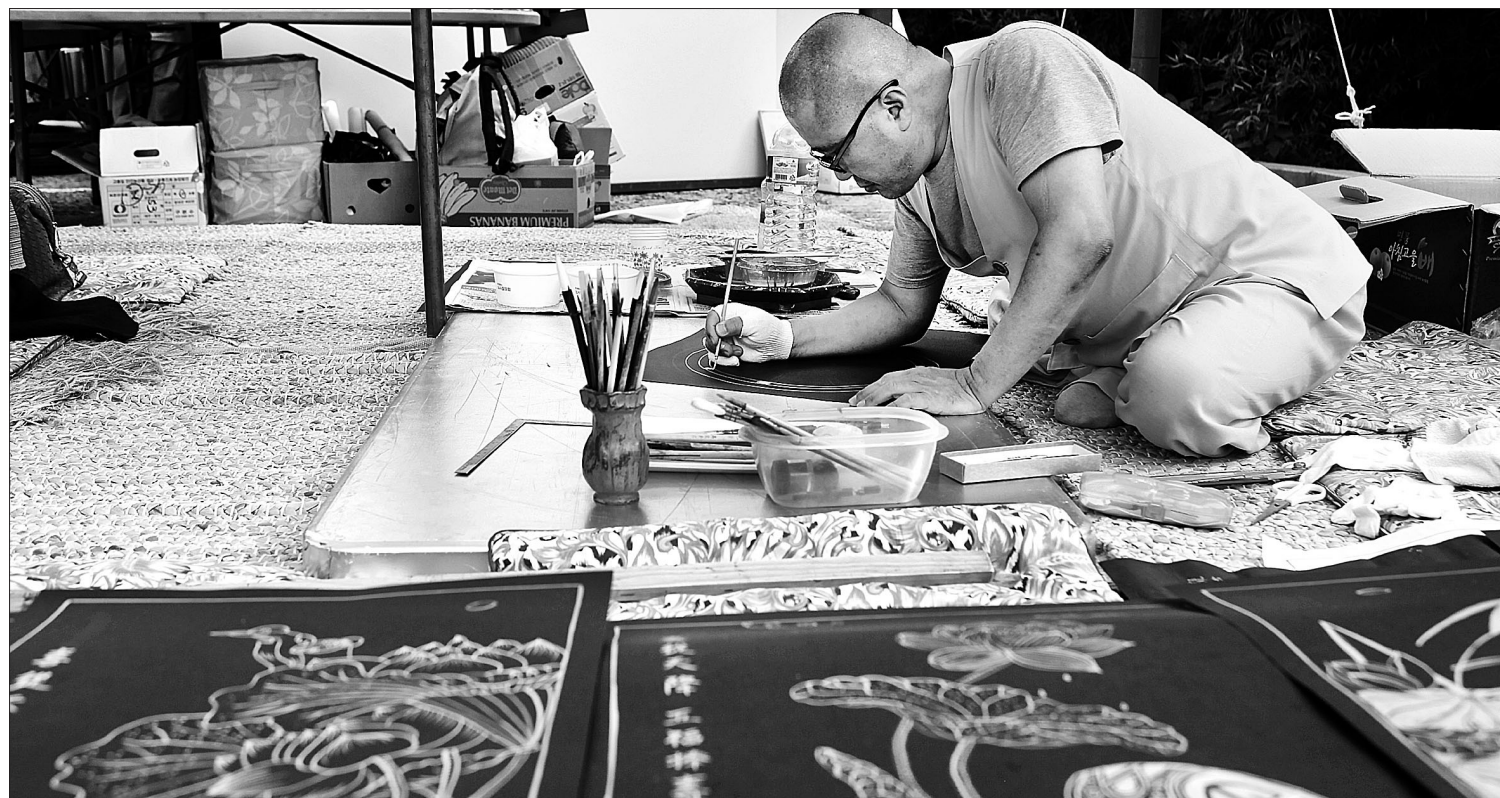
조선 후기 불교는 사원경제 활성화를 위해 다양한 계를 운영했다. 또 승역이 부과되면서 전문기술을 갖춘 승려들이 배출됐다. 승시(僧市)도 사원경제 활성화 방안 중 하나로, 불교문화향당에 앞장선 스님들이 수준 높은 작품을 내놓곤 했다. 사진은 팔공산 승시축제 봉행위원회가 주최하는 승시에서 한 스님이 불화를 그리고 있는 모습.

제 하에 산성을 제외한 국가부역에서 승려를 과도하게 동원하지 못하게 하였다. 산릉역의 경우 1757년을 끝으로 종식되었고 지방의 기타 공역도 필요한 양식을 관에서 지급하게 하였다. 또한 각종 잡역과 종이 등 특정 공물의 납부가 사찰 재정에 큰 부담이 되어 산성 방비전 액수의 충당에 어려움이 있다는 불만이 일자 정조는 1785년 남북한산성의 방비전을 반감시켰다. 이처럼 승려 노동력을 직접 활용하는 방식에서 금납화로 전환이 있었고 또 그 액수도 점차 주는 방향으로 나아갔다.