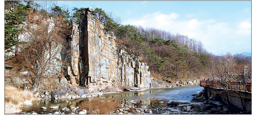
병풍처럼 둘러쳐진 기암괴석들이 절경을 자랑하는 단양8경중 하나인 '사인암' 전경.