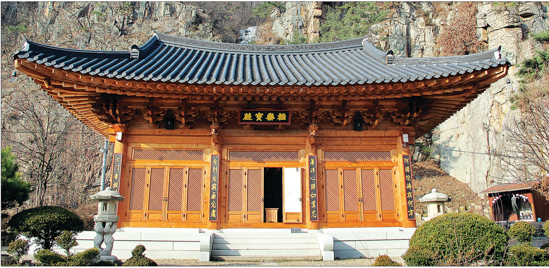
충북 단양군 대강면 사인암리 입구에 위치한 청련암은 조계종 제5교구 법주사의 말사이다. 새롭게 불사한 극락보전 뒤 기암괴석이 무척 아름답다.