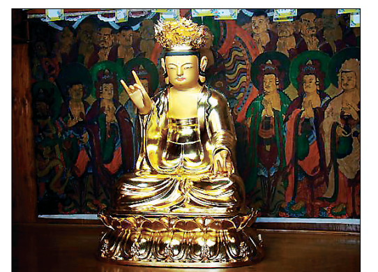
목조대세지보살좌상(충청북도 유형문화재 제 309호).

청련암의 목조대세지보살좌상은 비교적 큰 규모의 불상으로 제천 원각사의 목조관음보살상과 더불어 원 청련암의 아미타삼존상이던 유래가 있