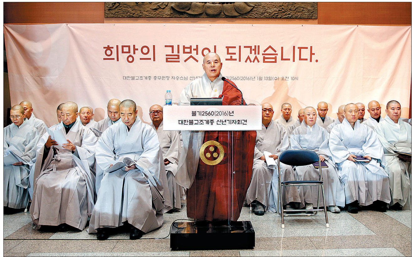
조계종 총무원장 자승 스님은 1월 13일 한국불교역사문화기념관에서 신년기자회견을 열고 2016년 중점과제를 밝혔다.

자승 스님은 "기존 노동위는 사회노동위로 확대되며 환경, 노동, 인권, 종교평화 영역과 지역 단위 화쟁네트워크를 구성해 전문적인 문제도 풀어가도록 하겠다"며 "특히 청년세대와 미래세대에 대한 정책개발사업을 적극적으로 지원해 나갈 것이다"고 말했다. 구체적으로 저출산고령화 문제 해결