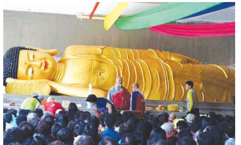
와불님이 모셔져 있는 적멸보궁