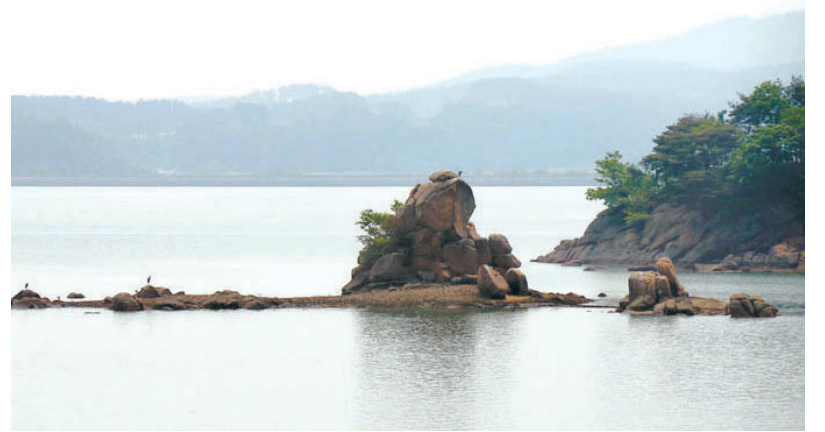
보타락가사 앞 바다의 '훈장 복(福) 두꺼비 바위'. 학생을 교육시키고 있는 듯한 형상이다