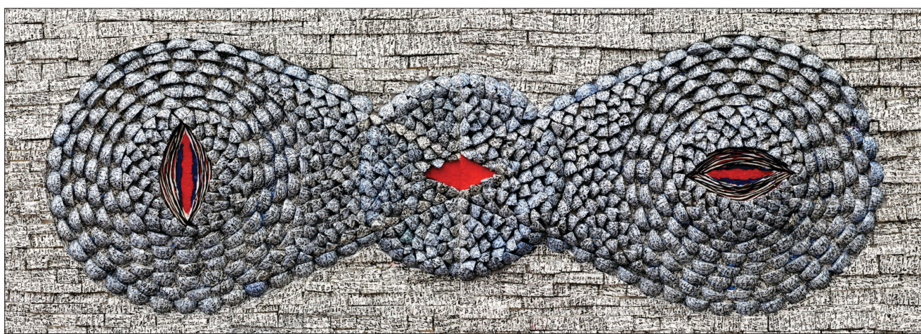
비상비비상(Neither thought nor non-thought) 42x53x2p, 2015, 한지, 혼합재료. 특유의 글씨체로 작은 한지에 써 내려가 개체를 만들고 이를 모아 평면에서 공간으로 조형해냈다.