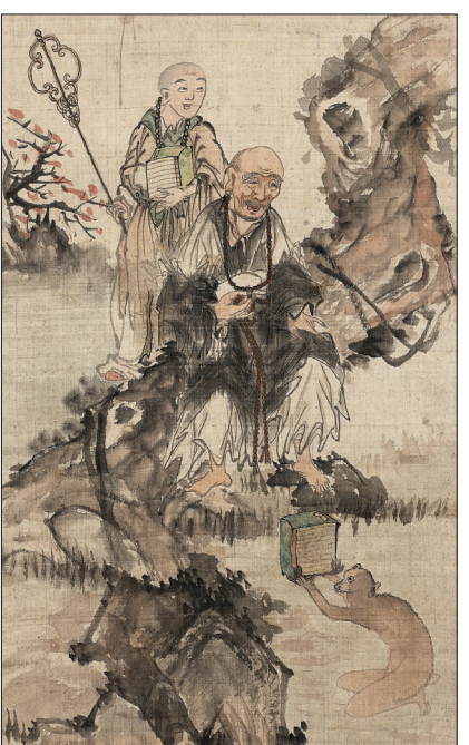
송하고승도 세부 모습. 원숭이가 고승에게 경전을 법공양하고 있다.

支幡)', '석제음각십이지문사각연(石製陰刻十二支文四角磬)' 등을 통해 살펴본다. '3부 길상동물 원숭이'에서는 '출세와 장수', '모성애', '벽사', '재주꾼'으로 상징되는 길상 동물인 원숭이를 관련 자료를 통해 살펴 볼 수 있다. 송하고승도 등 불교회화 다채 토우 비롯한 민속자료도 선봬 눈길을 끄는 것은 '장승업필 송하고승도(張承業筆 松下高僧圖)'다. 불교에서 원숭이를 '수행자를 보좌하는 동물'로 표현한다. 유명한 '서유기'에서 손오공이 원숭이인 이유이기도 하다. 중국의