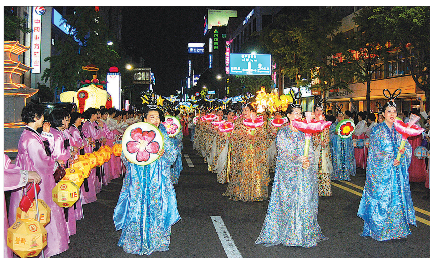
2008년 빛고를 연등축제에 선보인 한마음선원 광주지원 연희단.

요식에 앞서 어울림마당을 통해 연희단의 공연과 활기찬 프로그램을 선보일 계획"이라고 말했다.