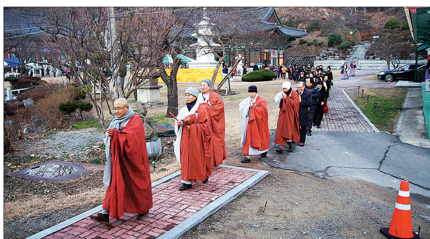
구랍 31일 군산 은적사에서 봉행된 금산사 해님이 법회에서 대중이 탑돌이를 하고 있다.

가족도 건강하고 주변사람들도 모두 행복했으면 좋겠다"며 "1년 뒤에 기회가 된다면 꼭 가족과 함께 사찰을 다시 방문하겠다"고 소감을 밝혔다.