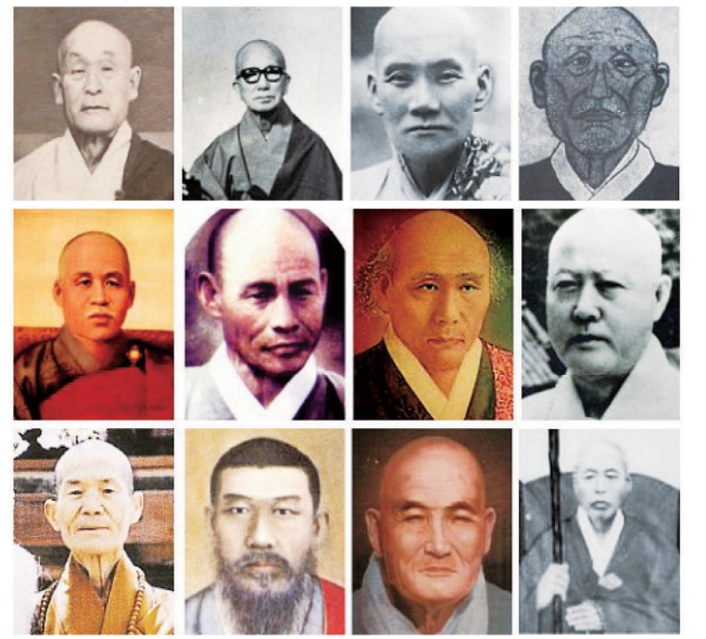
(왼쪽을 왼쪽부터) 효봉 해암 한암 학경 스님, (뿔뿔) 용성 만해 만공 동산 스님 (셋째줄) 고암 경허 경봉 만암 스님. 모두가 근현대 한국불교를 풍미했던 선지사들이다.

염화시중의 미소만 미소라. 한국 근·현대의 불교를 이끌었던 선지식도 증생제도를 위해 한 없는 자비의 웃음을 날렸다. 그러한 웃음을 선가(禪家)에서는 ‘황금털사자(金毛獅子)의 미소’라고 일컫는다. ‘황금털사자’란 존재의 모습을 표현하는 인간의 한계를 드러낸 뜻이라. 선사들은 삶 속에서는 물론, 법문에서, 제자 사랑에서 그 미소를 감물처럼 쏟아냈다. 이것이 노래로 우리 나오니 바로 선시(禪詩)가 됐다.