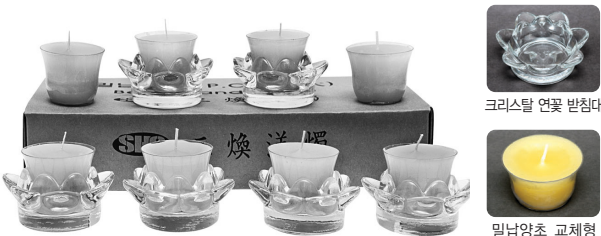
크리스탈 연꽃 받침대