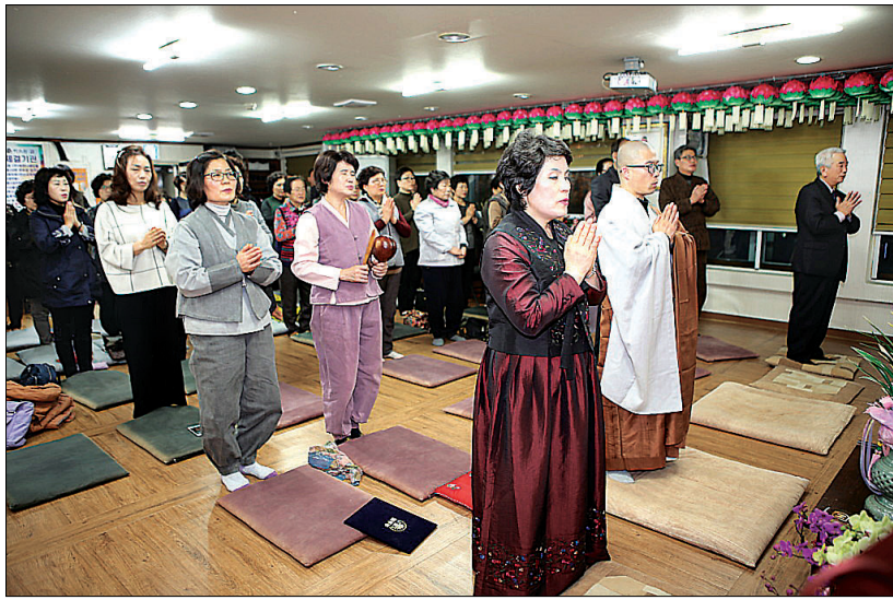
2015년 11월 열린 미소원 개원 4주년 기념법회 모습. 미소원에는 현재 25명의 회원들이 상담사 자격을 취득하고 전문성있는 봉사활동에 나서고 있다.