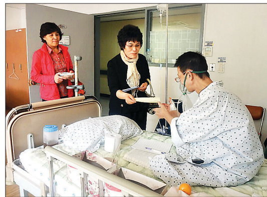
2012년 10월 국립마산병원 위문활동

상했다. “한 달에 10만원, 혹은 5만원, 하루에 천원 등 각 자신의 상황과 조건에 맞게 팀을 구성해 자발적으로 기도를 하고 법당을 위해 마음을 모았습니다. 한번은 폐지를 주위 모으시던 할머니가 법당을 차린다는 소문을 듣고 주머니에서 꼬깃꼬깃한 돈 2만원을 내고 가신 일도 있었어요. 이 정성들을 모았으니 더욱 열심히 회합할 일만 남았죠.”