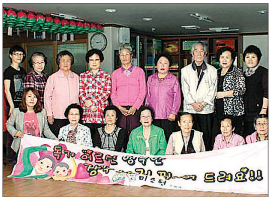
미소원 독거어르신 장수기원 사진촬영 행사 모습.