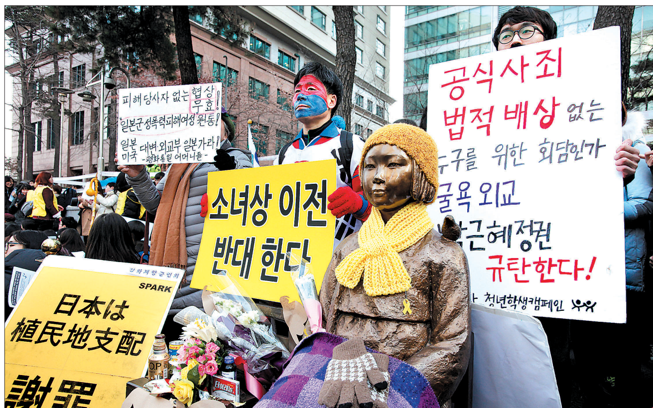
한국정신대문제대책협의회 등 시민사회단체가 구랍 30일 주한일본대사관 앞에서 ‘일본군 위안부 문제해결을 위한 정기 수요시위’를 개최한 모습.