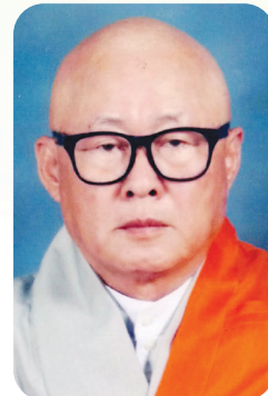
대한불교총화종 총무원장 혜각

병신년 새해를 맞아 세상을 바라보는 바른 마음을 가집시다. 세상을 바라볼 때 우리는 걸 모습만으로 마음대로 평가하고 생각합니다. 이는 세상에 대한 편견, 그리고 상대에 대한 모욕을 주는 것이라 생각합니다. 우리는 모두를 존경하고, 서로 받들고 이해하여야 합니다. 그렇게 함으로써 이는 먼저 자기를 똑바로 보게 만들 것입니다. 똑바로 보는 마음이 곧 자연스레 세상을 화합으로 이끌어 줄 것이고, 화합이 이루어지면 평화스러움도 함께 이루어질 것입니다. 이렇게 된다면 부처님의 불은이 온 세상에 퍼져서 우리는 모두 부처가 되는 것입니다.