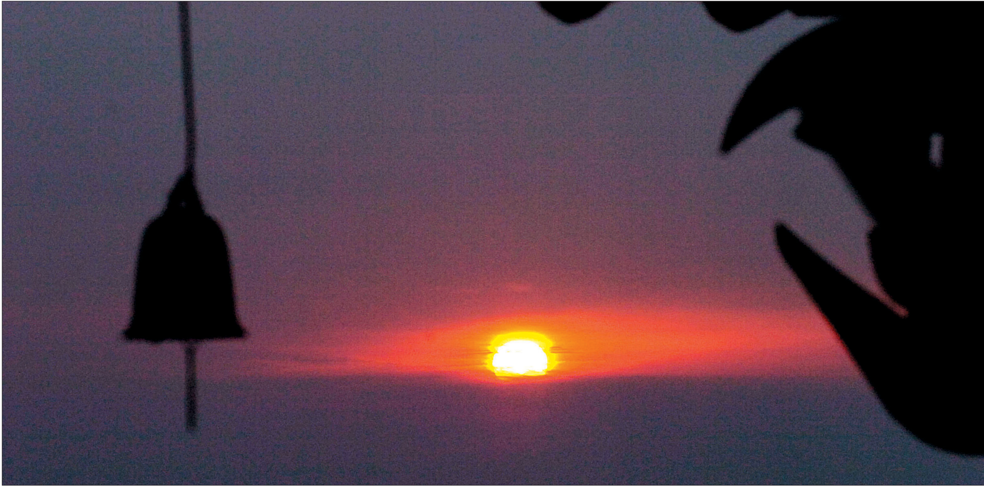
사람과 가장 가까운 모습의 원숭이의 해 병신년 새아침이 밝았다. 가능할 수 없는 시간 속에서 늘 우리는 원숭이보다 1분 1초가 고단하기만 하다. 미륵불 오시는 불국정토의 시간이 오기까지 56억 7천만년. 이미 오래전에 지나갔을 지도 모르는 그 만큼의 세월. 그 오랜 세월 중에 짧은 한 해를 또 맞는다. 저 남쪽 끝 부처님 도량 여수 향일암에도 또 새로운 햇살이 깃든다. 글·사진=김주일 기자