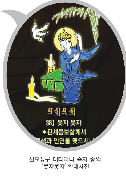
신묘장구 대다라니 족자 중의 '못자못자' 확대사진

법보시용으로 탁월하며 각 가정에 행운과 복을 선사합니다. 10개 이상 구매시 원하시는 문구를 새겨 드립니다.