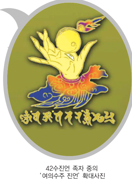
42수진언 족자 중의 '의수수진언' 확대사진