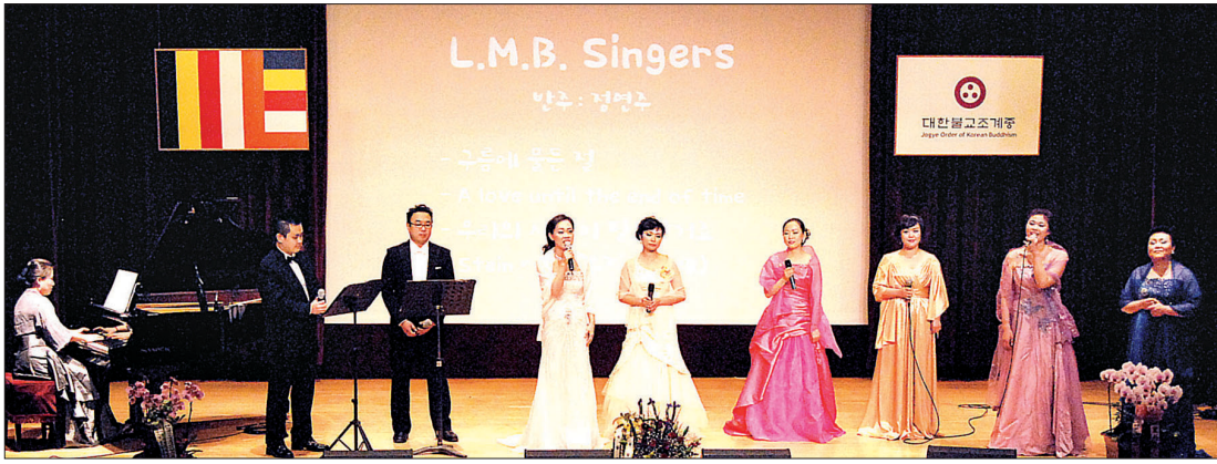
좋은벗풍경소리의 '붓다콘서트' 모습