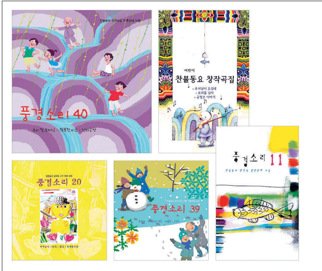
그동안 풍경소리가 내놓은 찬불가 음반 표지