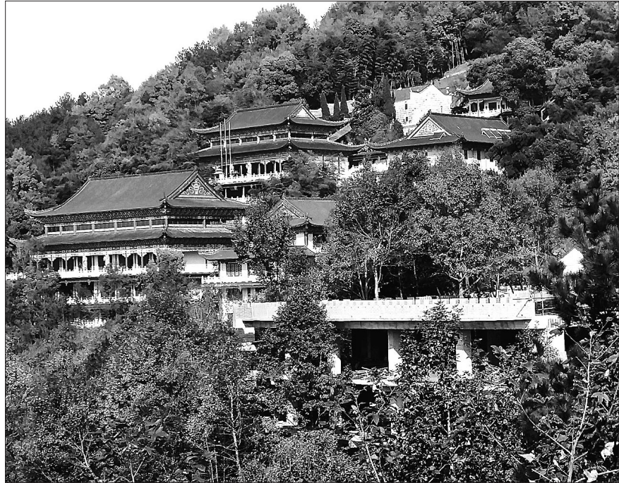
중국 태호의 서풍선사의 전경. 현대식으로 단장된 사찰은 중국 불교가 빠르게 발전하고 있음을 보여준다.