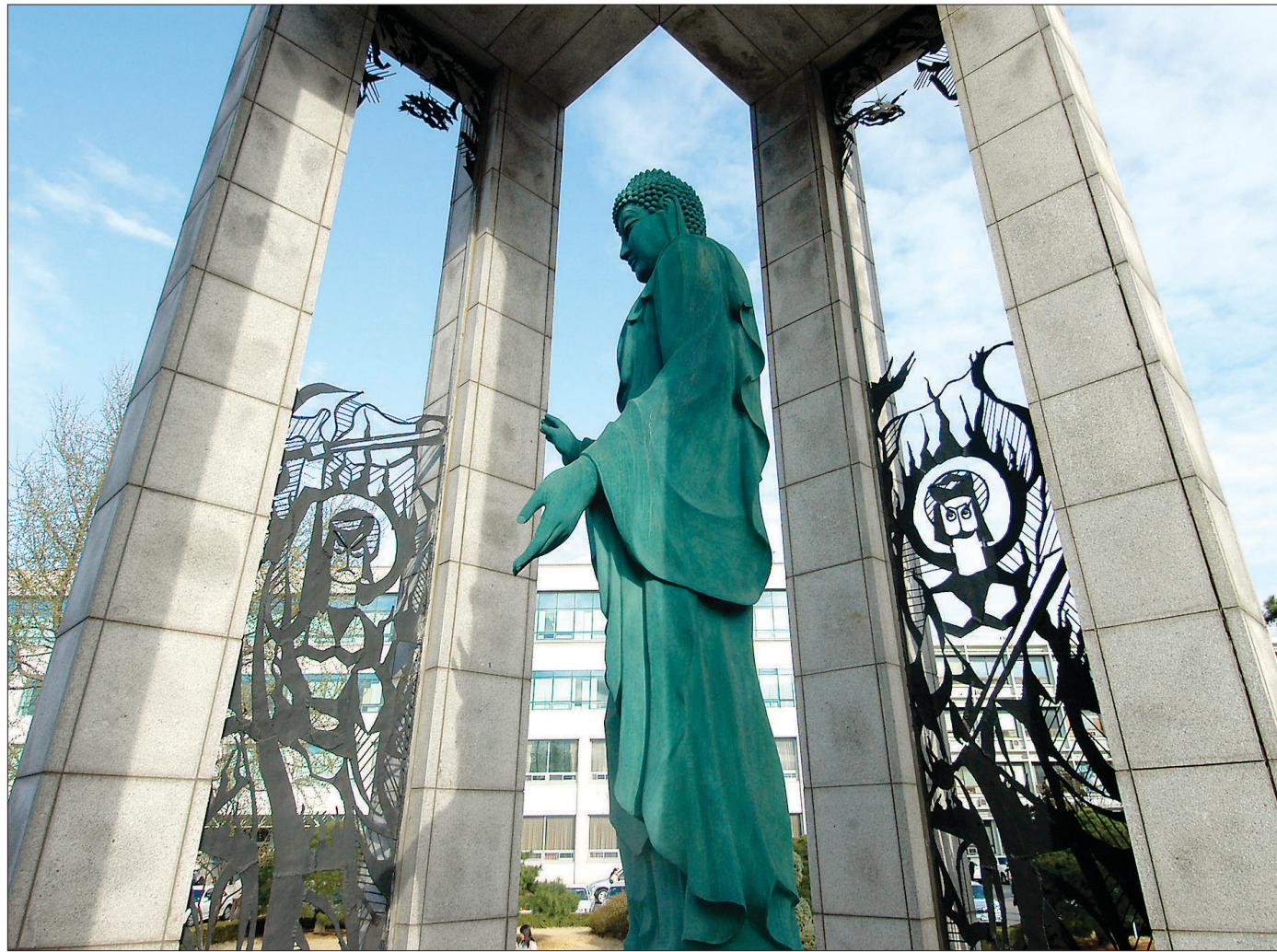
동국대 팔정도 광장에 세워진 부처님상. 그릇된 견해와 집중에서 벗어나 수 있도록 부처님은 팔정도를 설하셨다.

개념들은 일상생활에서 대상으로 궁극적 실재를 갖지 못하는 순간들에 마음의 대상이 된다. 우리는 우리 자신이 얼마나 자주 개념을 대상으로 삼고 있는 지를 알아내야만 한다. 봄이 있거나 들음이 있으면 눈