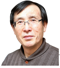
위요기 공주대 교수

개념은 오문에 충돌하지 않지만 실재는 오문에 충돌하는 것이다. 포도의 그림과 실제 포도는 눈의 문, 혀의 문이나 몸의 문에 와서 충돌하지 않지만 색, 맛, 단단함은 각각의 문에 와서 충돌하고 사라져 버리는 실재이다. 색, 맛, 단단함이라는 물질(무빠)은 일어나고 사라져 단지 17마음 순간 동안 지속될 뿐이다. 이런데 포도가 존재한다고 말할 수 있을까?