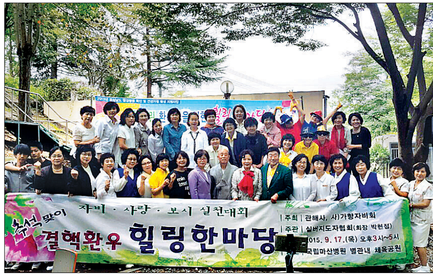
2015년 9월 열린 결핵환우 힐링 한마당

들은 쉽게 관해서에 들어 올수가 없습니다. 그래서 보 시금에 생각할 수가 없었죠. 그렇다고 손을 놓고 있을 수는 없었습니다. 그들을 위해 해야 할 일을 찾아야 했 지요”