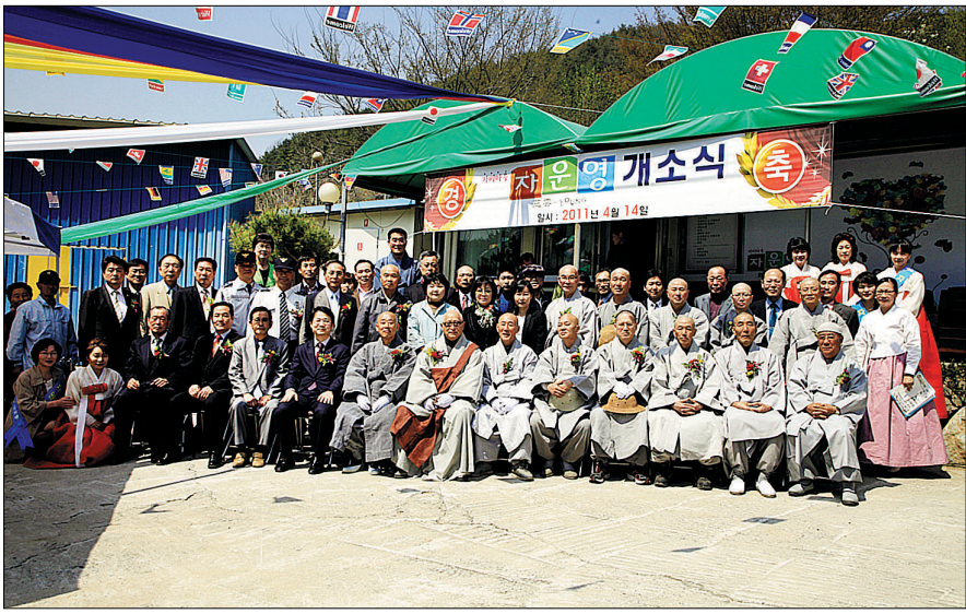
2011년 4월 개소한 자비마을 '자운영센터' 모습