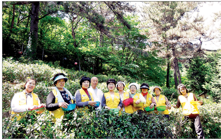
스님은 관해서서 매실과 녹차를 재배해 수익금으로 환우들을 돕고 있다.