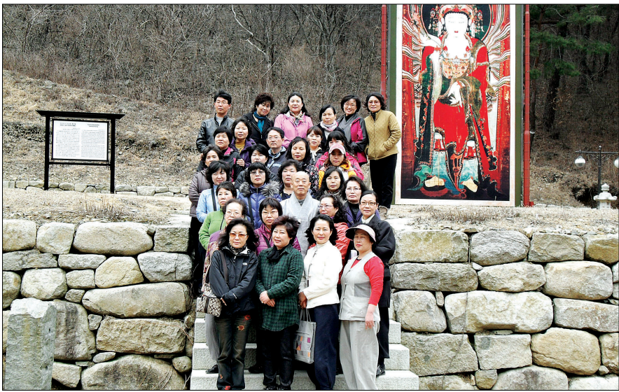
결핵 환자와 산사 순례에 나서는 스님의 모습