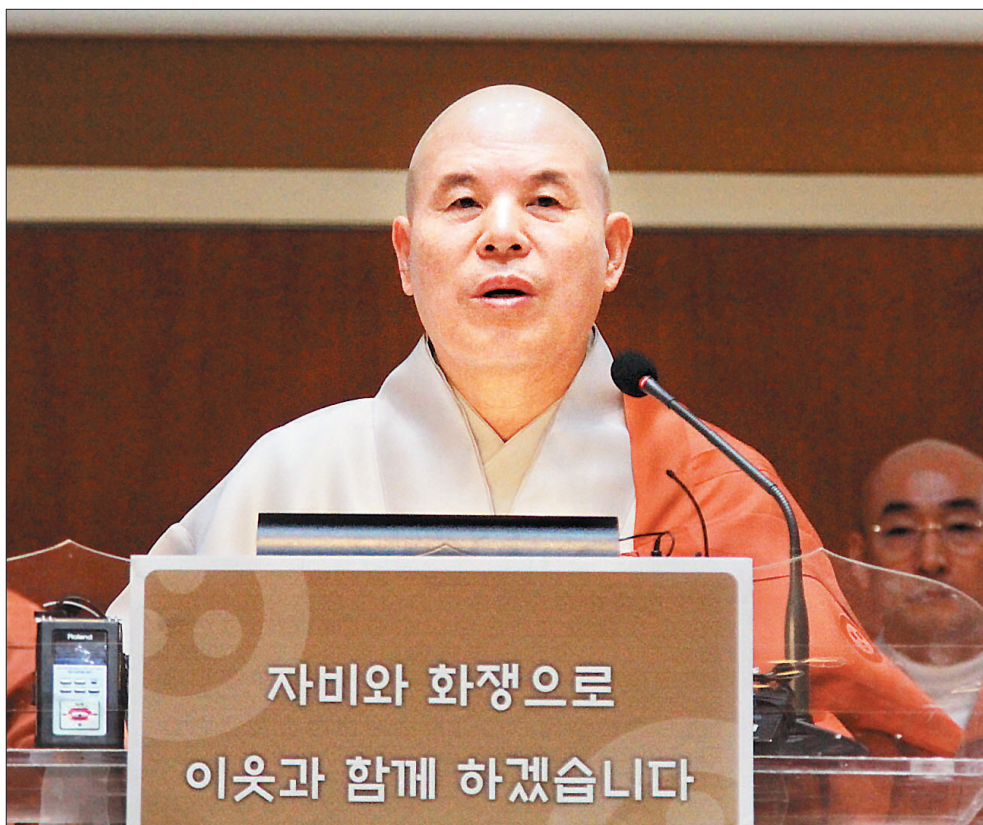
한상균 민주노총 위원장의 조계사 피신 24일 동안 불교계는 대화와 중재로 문제를 평화롭게 해결하기 위해 노력했다. 조계종 총무원장 자승 스님은 12월 9일 경찰의 체포 영장 집행에 임박하자 기자회견을 열고 갈등 해결을 위한 중재에 들어갔고(사진 왼쪽), 이를 받아들이는 경찰은 영장 집행을 연기했다. 한 위원장도 불교계의 설득에 자신 출두하기로 마음을 정하고 조계종과 조계사 대중의 보호 아래 일주문을 나섰다.(사진 오른쪽)