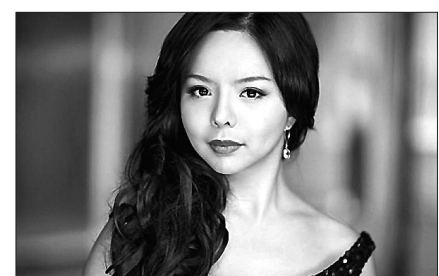
미스 캐나다 아나스타시아 린(Anastasia Lin)

'Tech Times'에 따르면 린은 이러한 중국 당국의 조치에 대해 그가 평소 중국의 인권 문제에 정치적 억압 상태를 비판하는 발언을 했기 때문이라고 생각하고 있다. 또한 그가 파룬궁(法輪功, 불교·도교·기공 등 혼합된 민간 신앙 운동) 활동하고 있는 것도 이유로 꼽혔다. 불교와 중국 요가 등을 수양하는 단체인 '파룬궁'은 1999년부터 중국 공화당이 불법으로