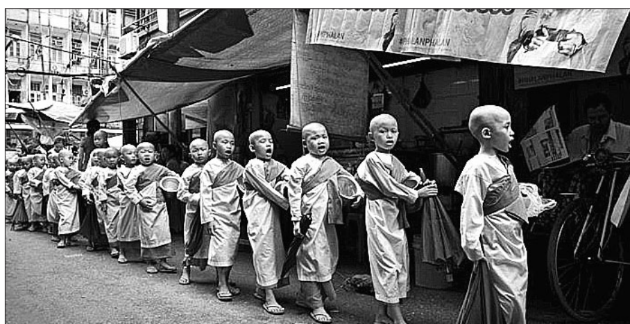
CAF와 GWP가 실시한 '세계기부지수(WGI)'에서 미얀마가 1위를 차지했다. 이는 미얀마는 불교도가 대다수기 때문에 종교적 기부 문화가 주된 원인으로 나타났다.