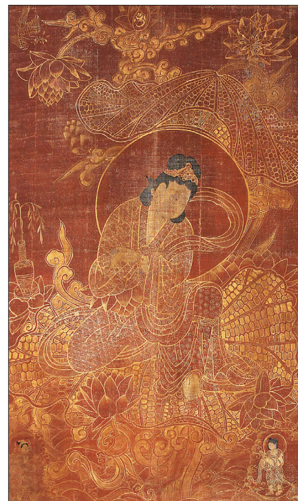
가마쿠라 사찰에서 발견된 선묘관음보살도.

는 중국에서 수용된 목판본을 우리 방식으로 재해석해 그린 거의 유일한 사례”라면서 “조선불화의 새로운 가능성을 밝힌 데에 또 다른 의미가 있다”고 평가했다.