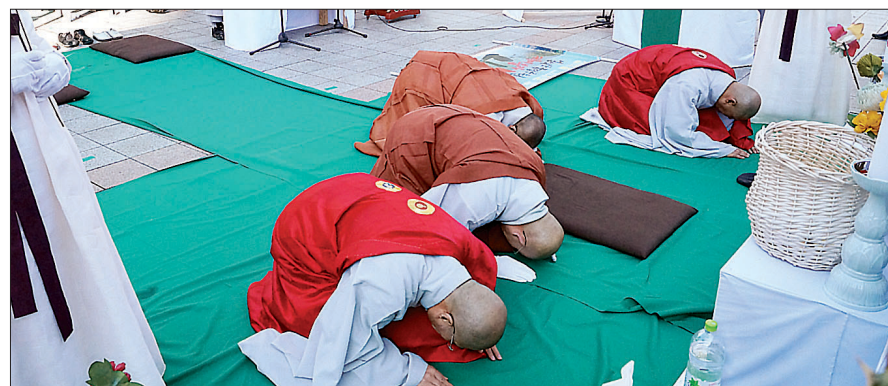
조계종 환경위원회와 불교사회정책연구소, 불교생명윤리협회 등은 11월 30일 서울 보신각 광장에서 ‘심정정·국토청정 발원 천도제’를 개최했다.