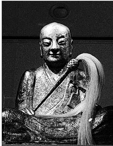
중국 푸젠(福建)성 양춘(陽春)의 마을 주민들이 지난 2월 네덜란드에서 발견된 '천년 미라불상'을 두고 소유권 분쟁의 소를 제기했다. 지난 1995년 12월 양춘 마을에서 도난당한 '장공조사상(사진 오른쪽)'이라는 주장이다.

그러나 그는 "이 불상이 양춘 주민들이 도난당했다 주장하는 '장공조사상'이란