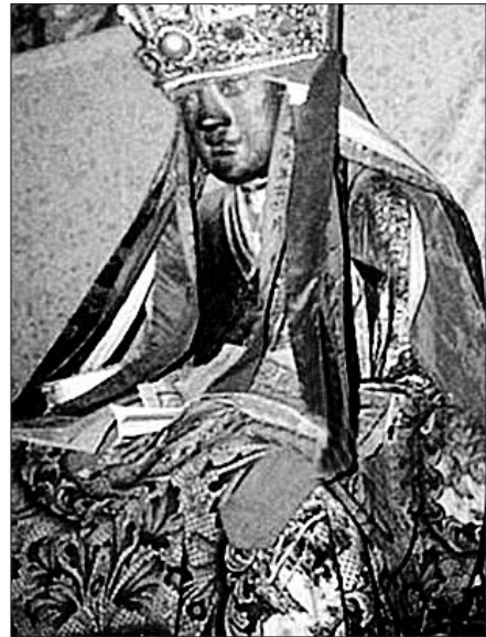
중국의 푸젠(福建)성 양춘(陽春)의 마을 주민들이 지난 2월 네덜란드에서 발견된 '천년 미라불상'을 두고 소유권 분쟁의 소를 제기했다. 지난 1995년 12월 양춘 마을에서 도난당한 '장공조사상(사진 오른쪽)'이라는 주장이다.

확실한 증거가 나온다면 기꺼이 돌려줄 것"이라 말해 반환 가능성을 열어뒀다.