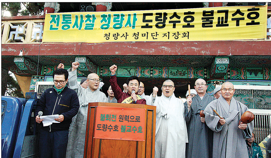
부산 청량사는 11월 25일 수행환경 수호를 위한 대책 마련 촉구 대회를 개최했다.