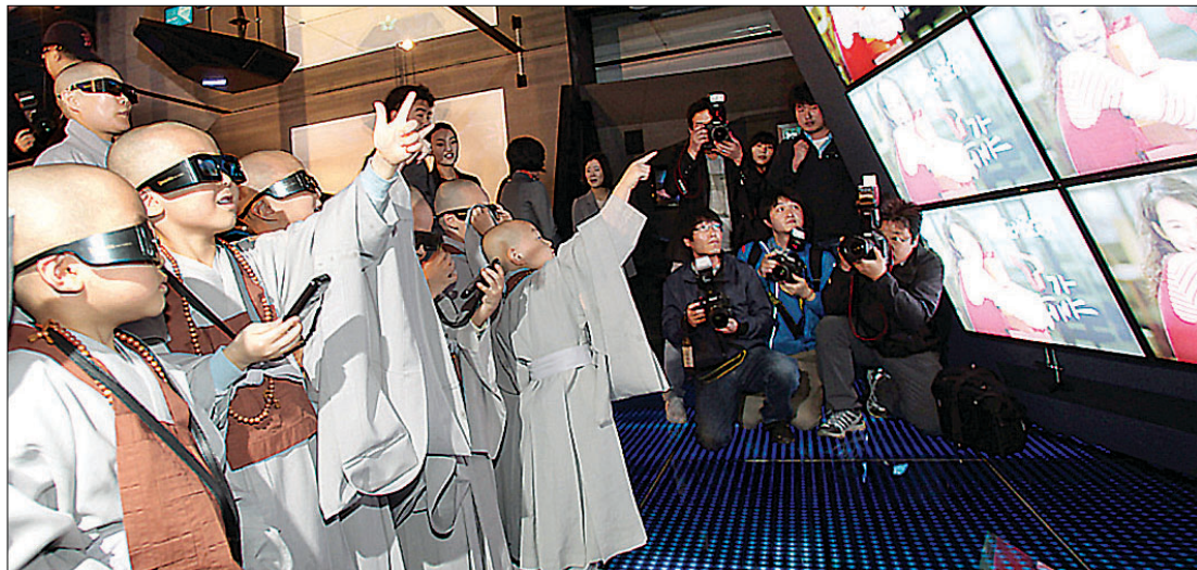
부처님오신날 sk텔레콤과 진행한 스마트미디어 체험행사서 3D TV를 체험하는 봉사자들.