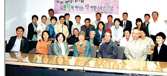
인터넷 카페 '붓다와 떠나는 책 여행'은 특정 불교서적을 정해 매주 책읽기 모임을 갖고 회원들끼리 의견을 공유한다.