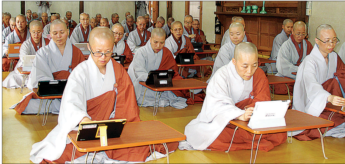
김천 청암사는 2011년 9월 4일 승가대학교 울원에 승가 기본교육기관 최초로 전자수업 시스템을 도입했다.

2000년대 들어 인터넷과 PC가 활발히 보급되면서 검색 엔진을 탑재한 포털사이트들이 잇달아 문을 열게 된다. 이들 포털사이트들은 '카페'라는 시스템을 통해 같은 관심사를 갖고 있는 누리꾼끼리 모임이 있는 장을 마련했다. 불교 관련 카페들이 생겨나기 시작한 것도 이때부터다. 현재 이들 카페는 포털사이트 '다음'에만 1만여