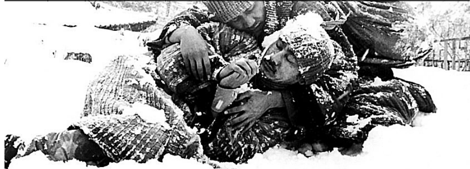
(위 현행은 신광철 '한국 불교영화의 회고와 전망', 한국영화데이터베이스 참조)

영화는 현대사회에서 가장 큰 영향력을 가진 대중매체다. 19세기에 처음 발명된 영화는 무성영화를 거쳐 장편 방식이 도입되고 현대에는 가장 많은 자본이 투여되는 일종의 거대 사업이 됐다. 전 세계에서 하루에도 수백만 명이 스크린 등을 통해 영화를 보고 있다.