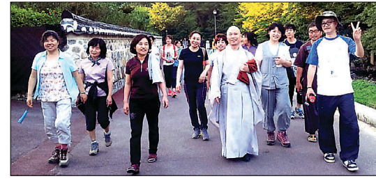
'불교와 여행을 사랑하는 사람들' 회원들은 함께 전국 명찰을 찾고 법회를 여는 국내 최대의 성지순례 모임으로 인터넷 카페 신행 모임의 전설 같은 곳이다.