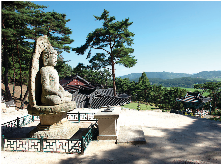
경주 남산 보리사 전경. 왼쪽의 석가여래 돌부처님은 '눈 속의 눈'으로 만나야 한다고 저자는 말한다.

전국 방방곡곡에 숨어 반딧불이처럼 지혜의 등불을 이어오는 암자들에 대한 기본적인 소개와 위치 정보 및 풍부한 서지자료, 수행자들의 일상과 고승들의 일화들, 작품사진들을 담아 작가 정찬주 특유의 성찰적인 글로 녹여낸 이 책은 작가의 몇 십