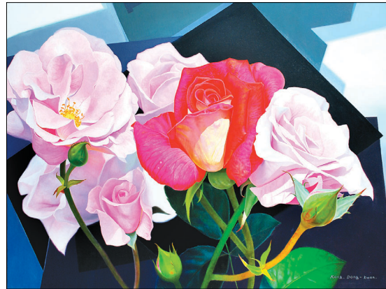
강동권 작 '장미가족'

강 작가는 "작품 속 꽃을 보는 이들이 순관과 영원, 피고 짐의 의미를 음미하는 시간을 갖길 바라는 마음에서 이번 전시전을