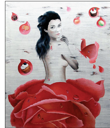
성수희 작 '이미 아름다운 그녀에게'

성수희 작가는 '비의 선물'을 주제로 11월 18일부터 24일까지 서울 종로 와룡동 갤러리 일호에서 전시회를 연다. 성수희 작가는 모래를 활용한 질감이 도드라지는 작품을 구현해왔다. 2002년 첫 개인전 '달의 선물(The gift of moon)' '선물 시리즈'와 마티에르(matiere) 위에 드로잉과 페인팅을 해 작품을 선보인 성수희 화가의 그림은 섬세하고 풍부한 감성이 묻어나는 작품이다.