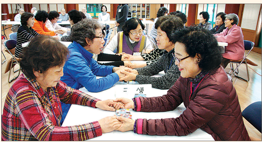
한마음선원 울산 지원에서 진행한 ‘행복한 사계절’ 프로그램 모습. 사진은 감사한 마음을 참가자들이 서로 나누고 있다.

혜안 스님은 “용광로가 그 어떤 것도 녹여서 새로운 좋은 제품을 만들어 내는 것처럼 우리의 마음도 한 생각을 어떻게 바