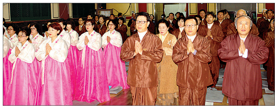
팔공총림 포교사회 창립법회에서 100여 포교사들이 불법홍포를 서원하고 있다.