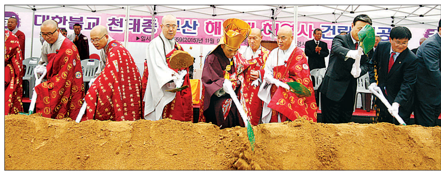
천태종은 부산 해운대에 해영사 건립 불사를 진행한다.

부산 해운대에 천태법광을 전할 새로운 법당이 들어선다. 천태종은 11월 9일 부산 해운대에서 해영사 건립 기공식을 개최했다. 해영사는 천태종이 삼광사, 광명사, 용평사, 정법사에 이어 부산지역에 5 번째로 건립하는 사찰이다.