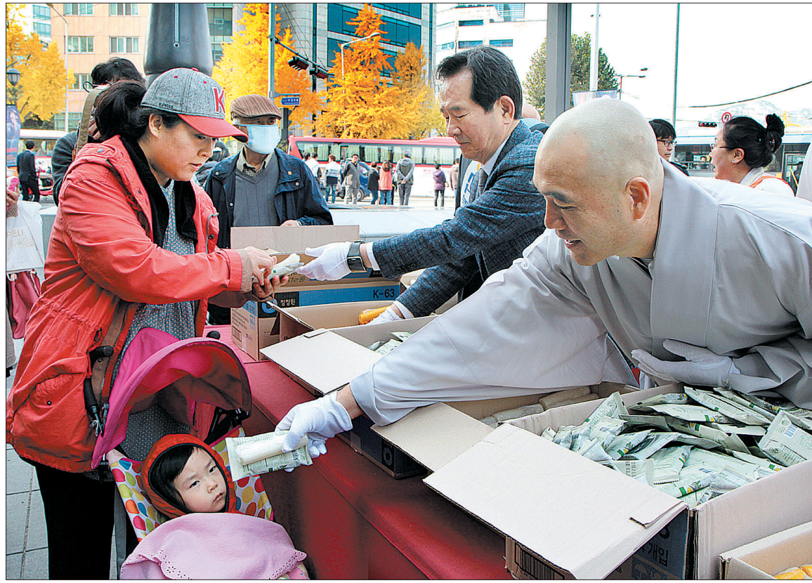
빼빼로보다 가래떡을 드세요