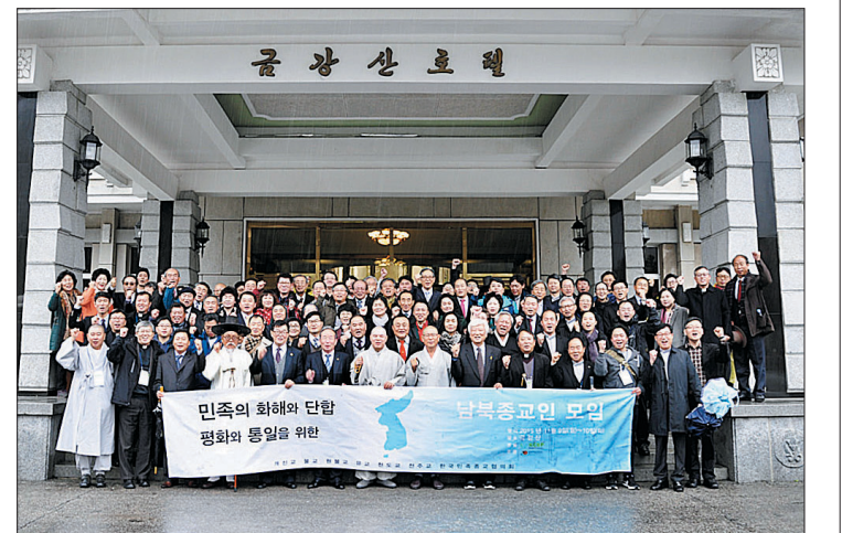
남한 한국종교인평화회의와 북한 조선종교인협의회는 11월 9일부터 10일까지 금강산의 금강산호텔에서 '민족의 화해와 단결, 평화와 통일을 위한 남북종교인모임'을 개최했다.

남한 한국종교인평화회의(대표 회장 자승, 이하 KCRP)와 북한 조선종교인협의회(회장 강지영, 이하 조종협)는 11월 9일부터 10