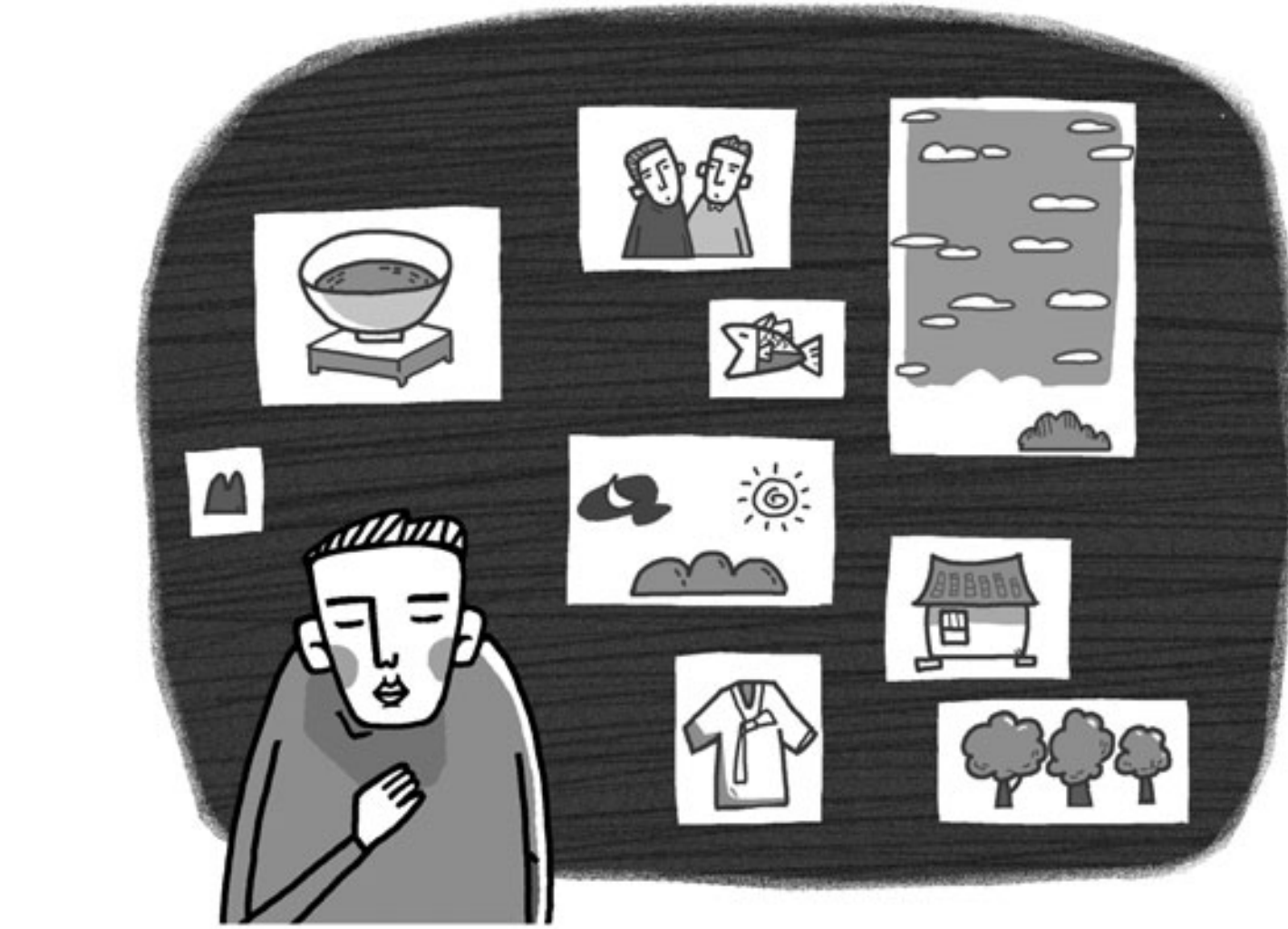
그림 · 최주현

질문 스님께서서는 나를 발견했다 하더라도 그것이 끝이 아니라 둘 아닌 도리를 실천을 해야 한다고 하시는데 둘 아닌 실천을 어떻게 해야만 하나요?