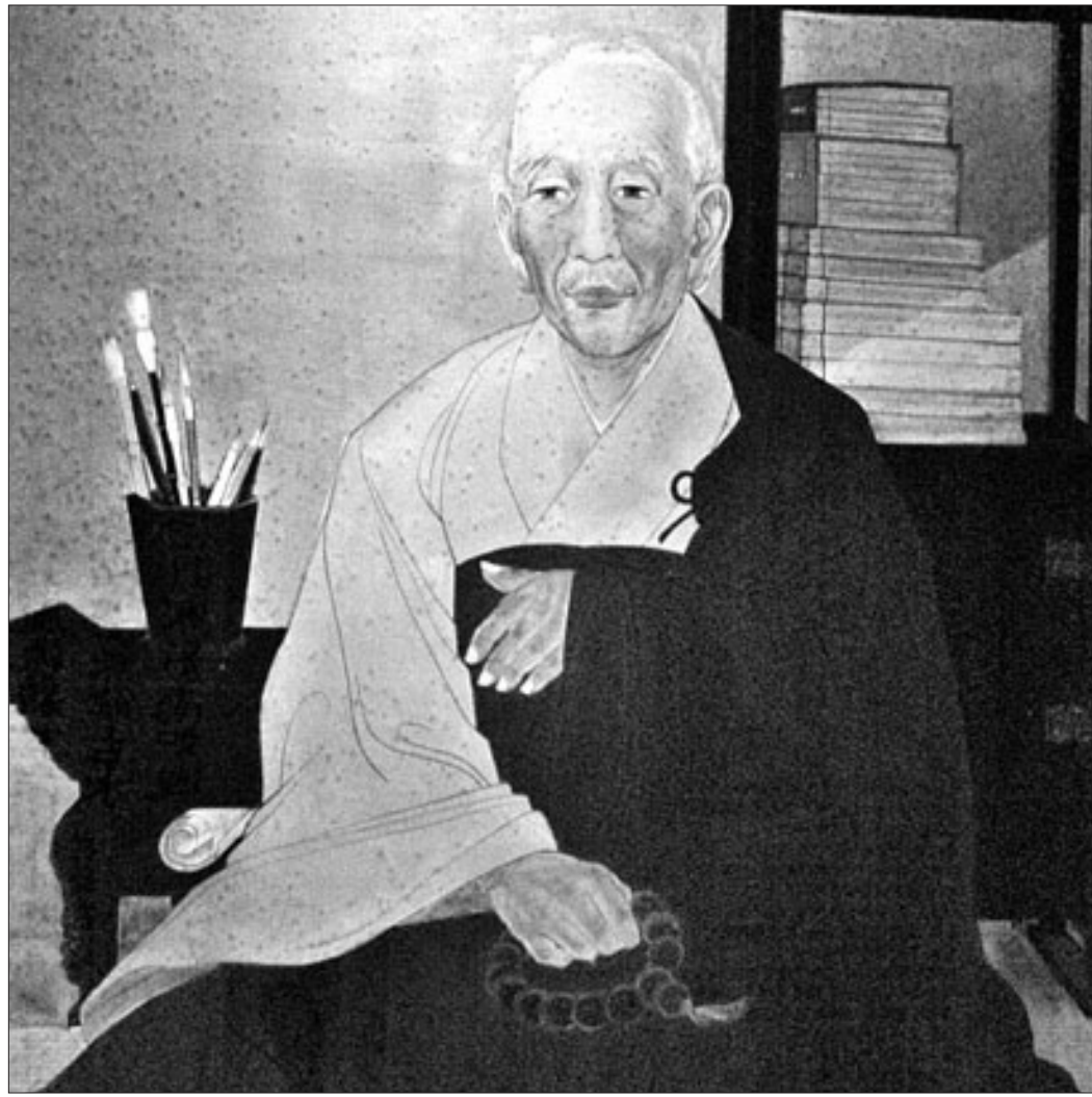
각훈의 '해동고승전' 불교 전래사 기술 고승 업적 찬양·호교론적 서술 대부분

왕력은 역대 왕조의 연혁을 간략히 기재한 것이고 신이한 일들을 기록한다는 뜻의 기이편은 항목 수로