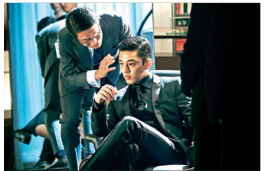
베테랑 속 '조태호'는 현대 자본주의의 부패한 재벌의 모습을 단적으로 보여준다.

류승완 감독의 '베테랑'이 1,350만 관객 동원에 성공했다. 흥행 성공의 비결이 무엇일까? 류승완 감독은 액션활극의 베테랑이다. 그러나 '베테랑'이 류승완 감독의 전작 영화에 비해 더 액션이 화려하거나 서사가 입체적인 것은 아니다. 외러 복고적이다. 류승완 감독이 인터뷰에서 밝혔다시피 '베테랑' 액션은 희극적인 요소가 있는 성룡의 액션을 답습하고 있어 그다지 새로울 게 없다.