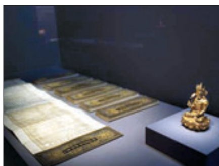
'호림 명품 100선' 2부 '불교미술-영원을 담다' 출품작 일부 모습

영하던 신사분관에 새로운 기획전시실을 마련해 상설전을 열게 됐다"며 "상설전에서는 박물관을 대표하는 유물을 항상 볼 수 있을 것"이라고 말했다. (02)541-3523 노덕현 기자