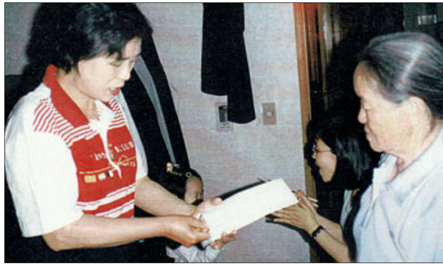
결손가정 전세금 및 병원비를 보조하고 있는 안성이 보현회 회장(사진 왼쪽)의 모습