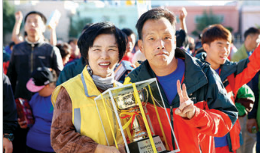
제18회 장애우를 위한 한마음체육대회. 보현회는 장애아동을 위한 축제도 열고 있다.