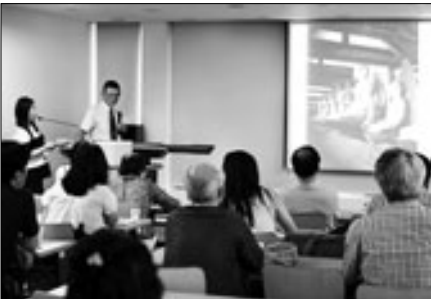
2014년 한국에서 열린 고판화 국제학술대회