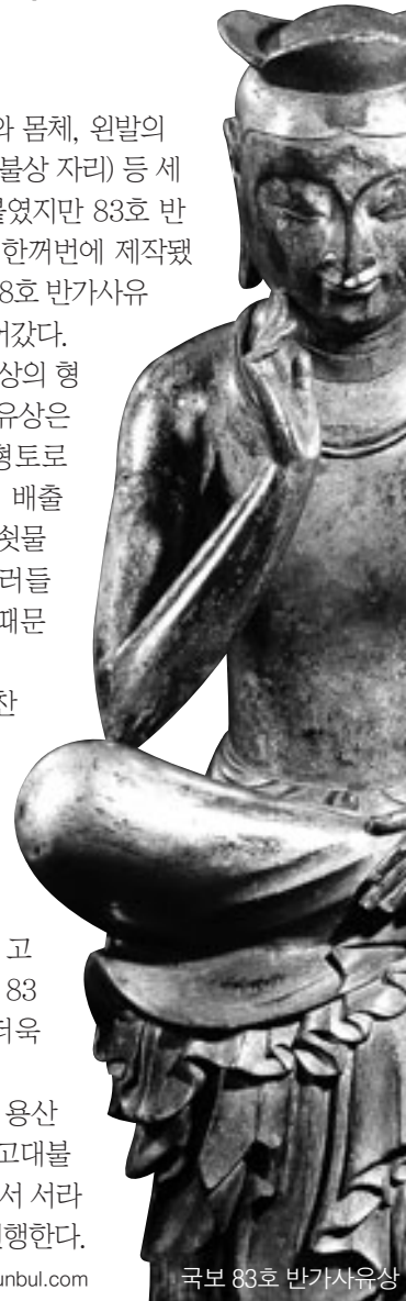
국보 83호 반가사유상