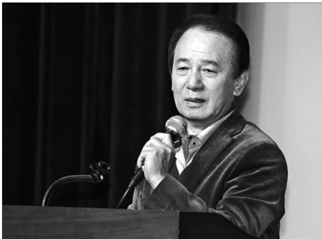
김홍신 소설가는... 충남공주에서 태어나 1975년 현대문학 <물살>로 등단했다. 15대 및 16대 국회의원, 민족화해협력국민협의회 집행위원장, 건국대 석좌교수 등 역임한 바 있다. 현재 중앙선거관리위원회 민주 시민정치아카데미 원장을 맡고 있다. 저서로는 <인생사물 설명서> <단 한 번의 세상> <인간시상> 등 있다.

인문학에서 가장 중요하게 여기는 것은 문·사·철, 즉 문화예술·역사·철학입니다. 철학에는 종교를 포함합니다. 우리는 역사적으로 작은 영토에서 큰일들을 많이 이뤄냈습니다. 삼국시대 때 당나라는 우리 민족을 두려워했습니다. 당나라 황실신료들은 "한국(민족은 언젠가 반드시 독립을 이뤄낼 무서운 민족이니, 하루빨리 침공을 서둘러 사내는 어린이아 부터 늙은이까지 모두 죽이고, 계집은 군사들의 위문품으로 나눠줘야 한다"고 황제에게 청했습니다. 황제도 이에 동의해 고구려와 백제를 침공했고, 고