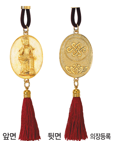
앞면 뒷면 의장등록

있다. 사용하는 중생이 금전의 고통에서 빨리 벗어나 평생 부자로 살게 축원 불공을 마친 복지갑으로 선물로도 뜻깊은 선물이 될 것이다. 남성용 반지갑 75,000원 여성용장 지갑 120,000원 전화로 신청하시면 택배로 보내 드립니다. (신용카드 분할가) 문의 : (02)723-4533 (사찰 · 스님 20% 할인) 농협 : 053-01-269765 (예금주 : 카필라불광사) www.kapilla.co.kr * 공휴일 접수 가능