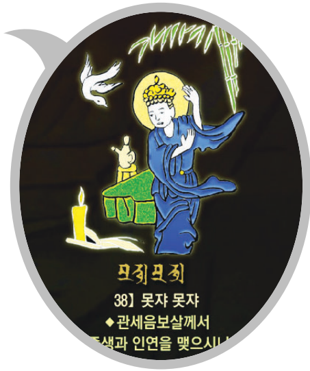
신묘장구 대다라니 족자 중의 '못자못자' 확대사진

법보시용으로 탁월하며 각 가정에 행운과 복을 선사합니다. 10개 이상 구매시 원하시는 문구를 새겨 드립니다.