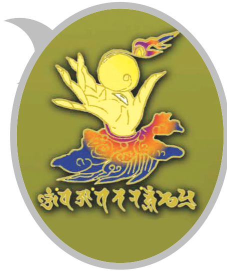
42수진언 족자 중의 '여의수주 진언' 확대사진