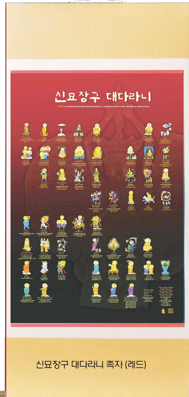
신묘장구 대다라니 족자 (레드)