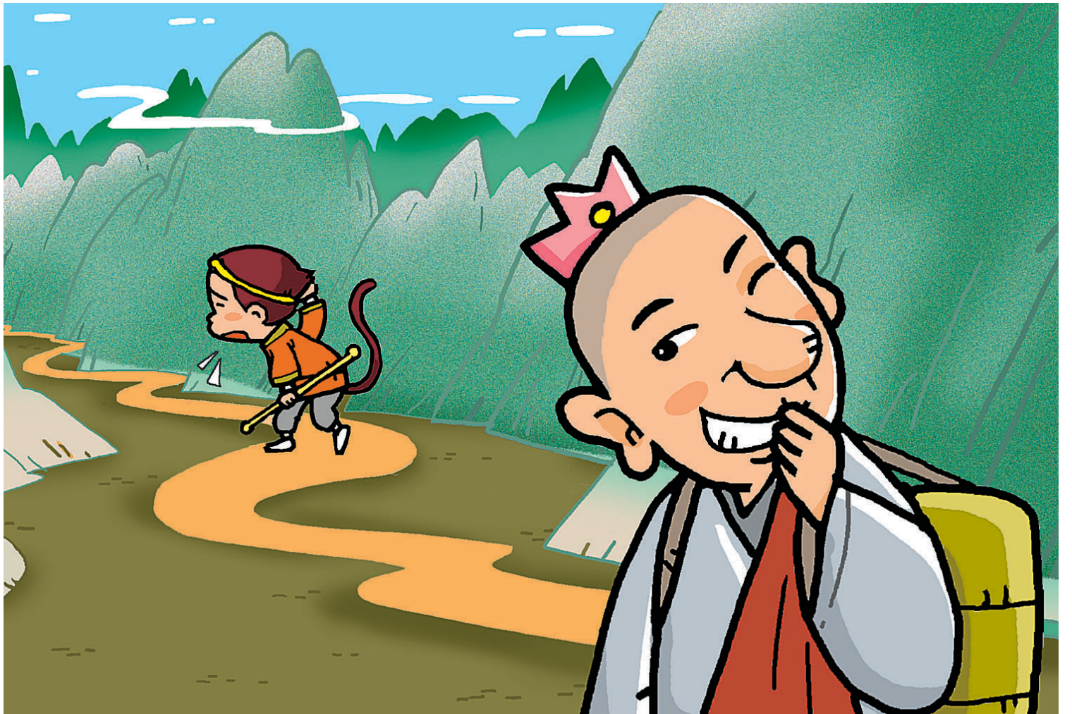
그림 · 최주현

이렇게 말씀하시며 음흉하게 흐흐~ 웃으신다... 어떨까요? 완전히 사기꾼에 음모가 냄새가 나겠지요? 그런데 저는 가끔 이렇게 생각해보기도 합니다. 좀 불경스럽지만, 너무 경건주의에 얽매이면 재미가 없거든요. 가끔 좀 불경스럽게 상상해보면서 웃는 맛이 얼마나 좋은데요. 그리고요, 이렇게 종교적인 경건성에 너무 매달리지 않고 자유롭게 생각하면 새롭게 연는 것도 참 많답니다. 전혀 다른 각도로 생각을 해본다는 것이 중요한 거죠. 앞에 좀 불경스럽게 이야기를 꾸미는 속에 몇 가지 취할 점들이 있습니다. 마음을 길들이는 데는 좀 극단적인 수단도 필요하다는 겁니다. 어떤 경우 정말 독한 처방을 써야 하는데, 그럴 때는 마음을 살살 구슬러서 그 독한 처방을 받아들이게 할 필요가 있다는 것이지요. 바람직한 것은 마음을 잘 달래서 친구처럼 데리고 가는 것이 좋겠지만, 언제나 그럴 수만은 없는 겁니다.