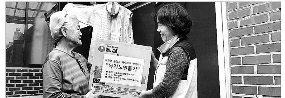
송산노인종합복지관은 10월 19일 독거노인 1백 가구에 라면 100상자를 전달했다.

쌀쌀해진 날씨에도 어려운 이웃을 위해 자비 나눔을 실천하는 불교계 손길은 따뜻하다.