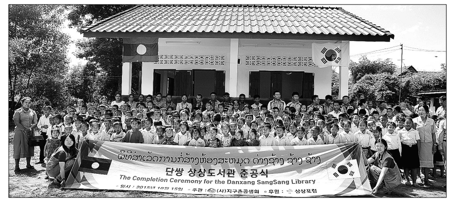
지구촌공생회는 10월 15일 라오스 단쌍마을서 '상상도서관' 준공식을 개최했다.