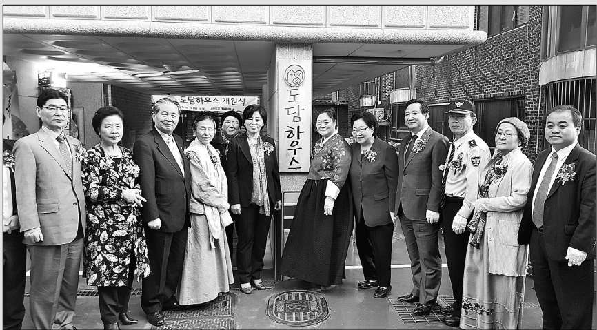
깨달음과나눔은 10월 28일 미혼모자 기본생활시설 '도담하우스' 개원식을 개최했다.

사회적 위기에 처한 미혼모들을 지원코자 마련된 도담하우스가 공식 개원했다.