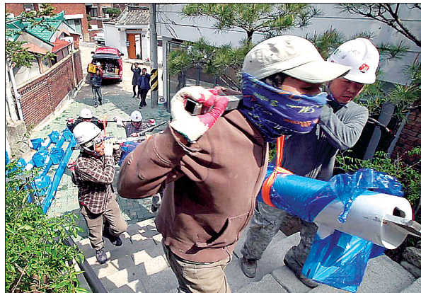
차를 달 수 없어 인부들이 수백년 전과 같이 직접 구조물을 나르고 있다.