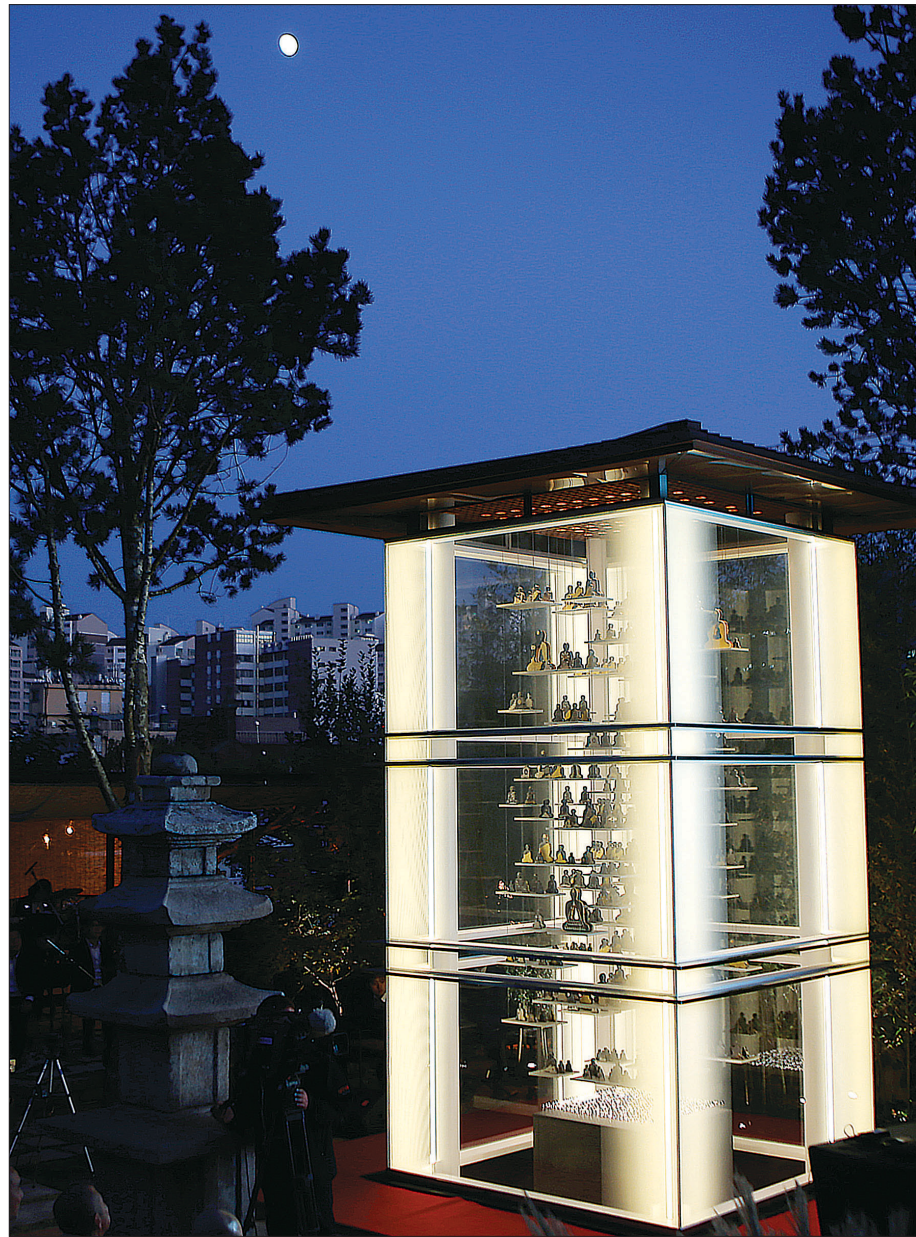
10월 24일 점등한 유리구조 미래탑(사진 오른쪽)과 과거탑(고려석탑).