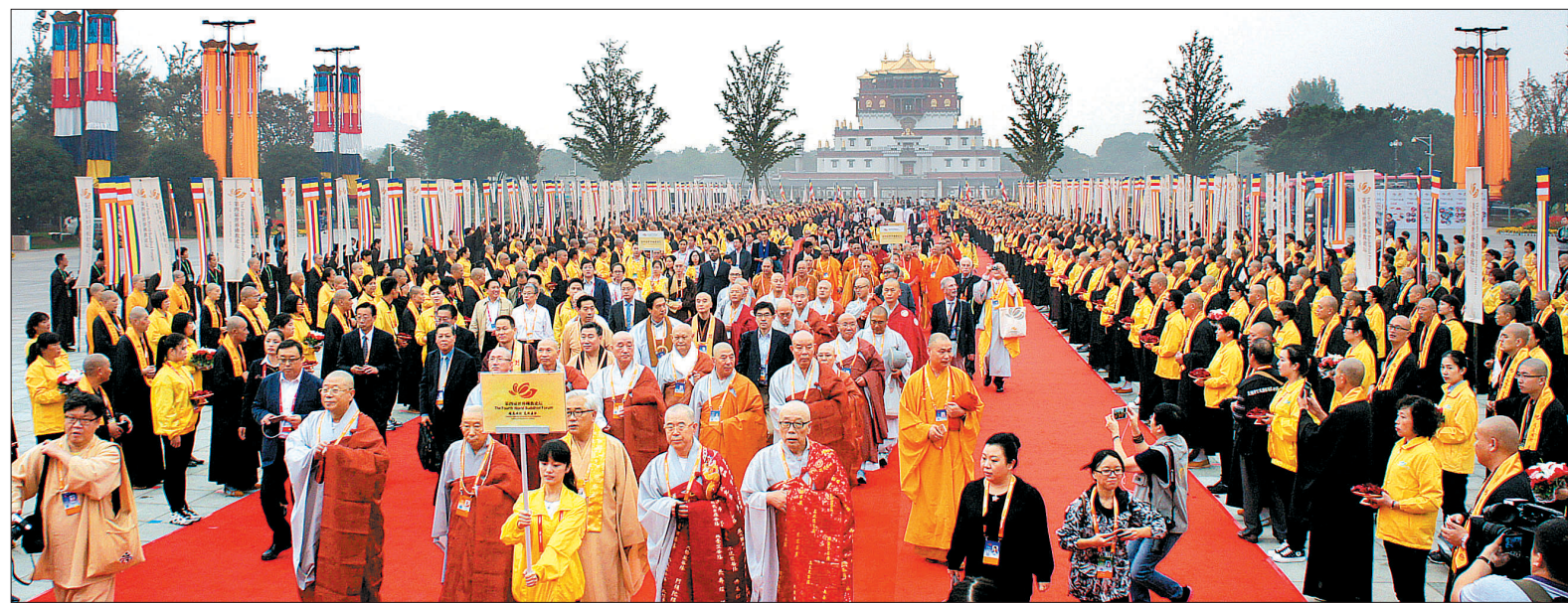
10월 24~25일 중국 무석 영산법궁에서 제4차 세계불교포럼이 열렸다. 이번 포럼에서 한국, 대만, 스리랑카, 미국 등 10개국 불교 지도자들은 '세계불교단체 유대 강화' 등을 비롯한 9개항을 공동 선언했다. 사진은 한국 대표단 스님들이 개막식에 입장하고 있는 모습.